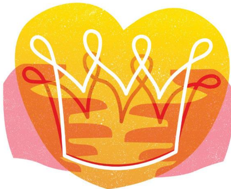
Illustratie bij het jaarthema PKN 2024/2025: 'Als nieuw!'

Het jaarthema is inhoudelijk gebaseerd op het hoofdstuk 'Van U is het Koninkrijk' uit de visienota van de Protestantse Kerk. Als wij leven in het licht van Gods Koninkrijk, gaan we dingen weer zien als nieuw.